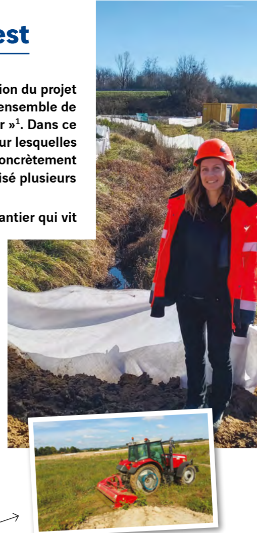
Fauchage réalisé et renouvelé en avril

Pour cela, la spécialiste a mis en place plusieurs mesures et réalise une visite environnementale deux fois par semaine afin de détecter les anomalies présentes et d' anticiper celles qui pourraient survenir.