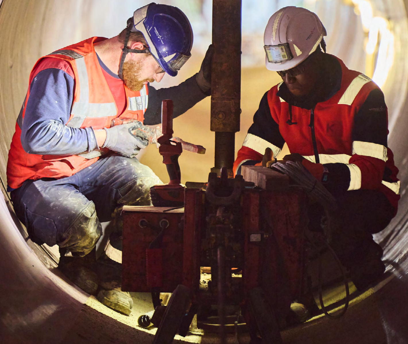
Installation d'un nouveau tube à l'intérieur d'une buse métallique.

Les buses constituent une catégorie spécifique de passages sous l'autoroute. Il s'agit de « tuyaux » qui selon leur nature et leur environnement peuvent remplir différentes fonctions : rétablissement de cours d'eau ; passage de la faune piscicole et/ou terrestre ; passage routier ou piéton. Ce programme vise principalement à renforcer et prévenir l'usure naturelle de ces tubes métalliques qui constituent les buses.