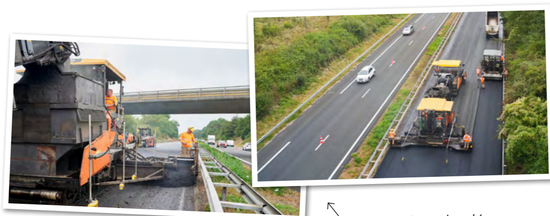
Application du nouvel enrobé.

① Pour limiter la gêne, la circulation est préservée dans les deux sens durant toute la période des travaux.