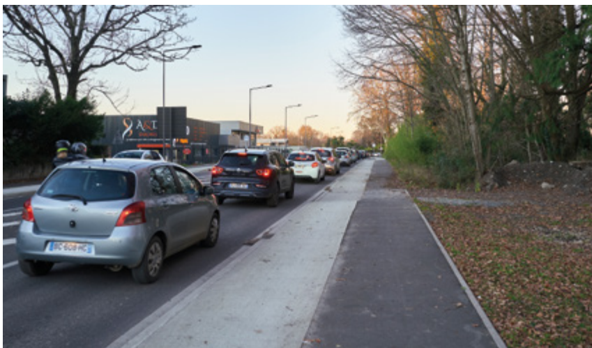
Circulation saturée à l'approche du giratoire Nobel sur la rocade paloise.